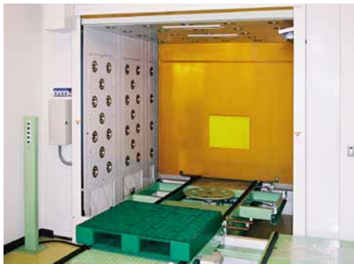
■ 回転式チェーンコンベア設置例