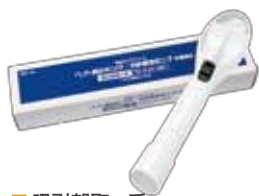
■ 吸引部取っ手 TR-H-01-001 / 1個入