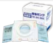
■ 取替用集塵袋 TR-04-002 / 5枚入