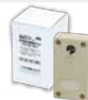
■ 完了信号出力回路ボックス TR-05-001 / 1個

●この製品は日本国内用ですので日本国外では使用できません。また、日本国外でのアフターサービスも受けられません。●製品、および付属品の改造は、絶対にしないでください。