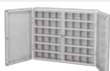
■ マイキャップボックス [48人用] TR-F-48