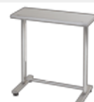
■ 床置用置台[2人用] HW-TRC用 / 1台