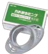
■ 吸引マイキャップベース TR-F-B / 1個入