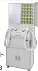
■ 設置台セット [2人用] TR-FW-48