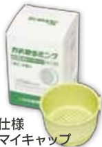
■ 抗菌仕様 吸引マイキャップ TR-F-01 / 4個入