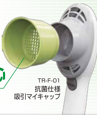
TR-F-01 抗菌仕様 吸引マイキャップ

吸引部取っ手への吸引マイキャップの取り付け・取り外しは、左図のように行なってください。無理やり取り付け・取り外しを行なうと損傷するおそれがあります。コンタクトレンズを使用の人は、そのまま(付けたまま)使用しても取れることはありません。万が一取れた場合、吸引マイキャップの底面(メッシュ部)で止まります。