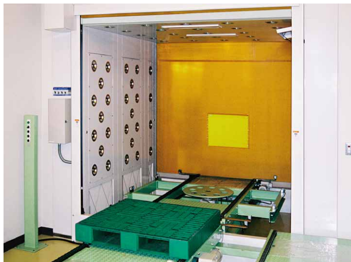
■ 回転式チェーンコンベア設置例